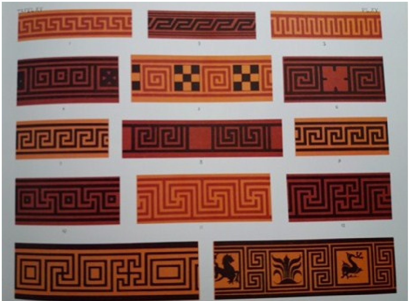
Particolare di tavola con schemi grafici di greche, da Owen Jones, "The Grammar of Ornament" (1855).

Ma come si passa dalla singola cella al tutto? Qui entra in campo l'incredibile abilità con cui gli antichi maestri irlandesi e scozzesi ci avevano già stupito quando ne studiammo gli intrecci. Vi è infatti una parentela con gli intrecci, perché anche nei key patterns lo stupore nasce dal contrasto fra la composizione geometrica regolare posta al centro, e la libera chiusura dei bordi. Rispetto agli intrecci, qui il gioco appare un po' più chiaro e semplice, ma si tratta di una falsa impressione. Se infatti il modulo ha caselle dispari, anche il pattern "provvisorio" (chiamiamo così l'elemento che si ripete e si compenetra) sarà numericamente dispari. In sostanza, se la composizione deve estendersi sull'intera superficie a disposizione (sempre nel rispetto di una misura esatta e rigorosa, e non con la casualità di una tappezzeria ritagliata), allora è indispensabile premettere una serie di calcoli, in modo tale da poter calibrare la griglia generale in base alla superficie totale e ai moduli richiesti. Cosa, ovviamente, tutt'altro che facile.