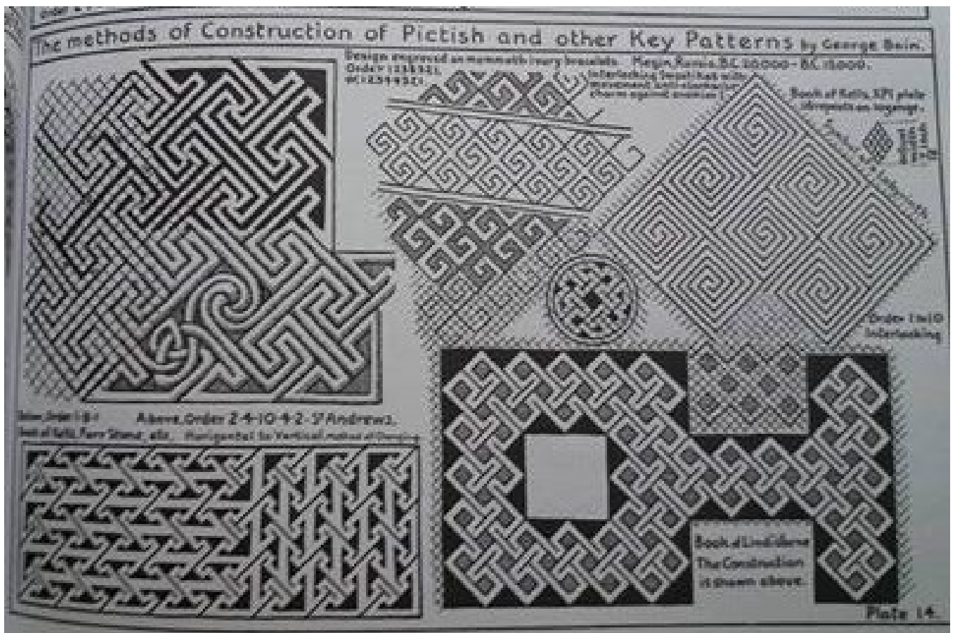
Tavola con schemi grafici di key patterns, da George Bain, "Celtic Art" (1951).

ossia il classico motivo geometrico a correre, usato perlopiù nella pavimentazione musiva.