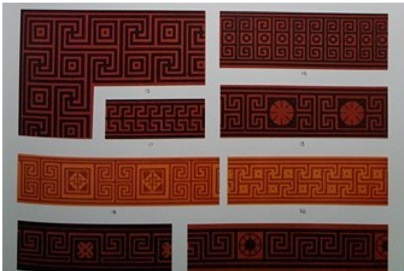
Particolare di tavola con schemi grafici di greche, da Owen Jones, "The Grammar of Ornament" (1855).

è necessario averne la chiave. In generale possiamo affermare che ogni famiglia di ornati ha una propria chiave di accesso, senza la quale è impossibile affrontarne l'ideazione e la progettazione. La chiave è un codice genetico, una struttura base elementare, moltiplicando e componendo la quale si ottengono i vari motivi appartenenti alla famiglia. Nel caso di un key pattern la chiave è, come abbiamo visto, il modulo base del meandro; nelle stelle islamiche essa è data dall'irradiazione dei poligoni regolari; negli intrecci, dal raccordo esterno della griglia di base.