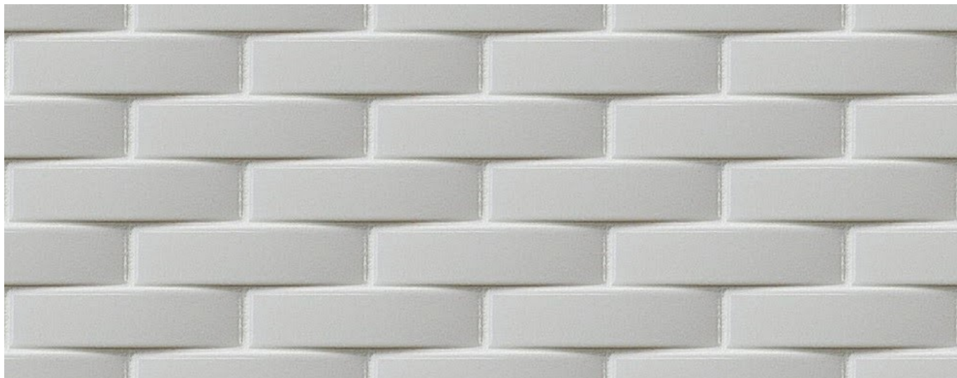
Mosaico per rivestimento parietale a tessere convesse.

Ad un livello compositivo appena più complesso si hanno i motivi architettonici e tessili detti “a lisca di pesce” o, con una definizione francese altrettanto metaforica, pied-de-poule . Anche qui, e gli esempi potrebbero continuare a lungo salendo nella scala della complessità, intreccio simulato e intreccio reale convivono paritariamente. Insomma, le dinamiche dell’intreccio sono tra le più universali nel sapere visivo antico e moderno. Il loro riproporsi, anche nei contesti produttivi tecnologicamente più evoluti, lascia pensare che esse continueranno a svolgere un ruolo vitale nel nostro immaginario. Ma la grande avventura tardoantica e medievale, che ha fatto della tecnica dell’intreccio un’arte raffinatissima, resta un capitolo irripetibile nella storia della cultura umana.