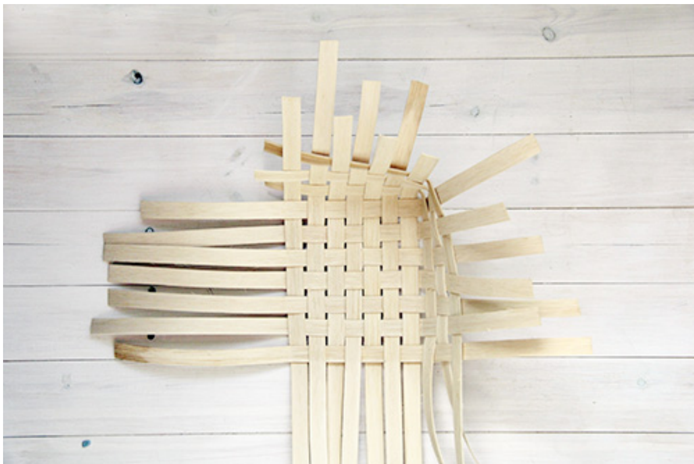
Intrecciatura di strisce di bambù.

Si consideri la più semplice fra tutte le tassellazioni del piano: la scacchiera. Si immagini che i quadrati siano formati da fettucce bianche e nere accavallate perpendicolarmente, e si penserà a delle strisce di pelle intrecciate, come nelle cinture o nelle borse. Ancora, basta un'ombreggiatura a far sembrare i quadrati alternativamente aggettanti o rientranti, come avviene nell'intreccio reale per effetto dell'accavallamento tra una striscia e l'altra. Se poi le file di quadrati vengono sfalsate in modo che la separazione tra un quadrato e l'altro poggia esattamente a metà del quadrato sottostante, si avrà l'effetto tipico dell'intreccio in vimini, dove una serie di fibre parallele, disposte a formare un involucro continuo, passa sopra e sotto altre fibre disposte perpendicolarmente, ma a intervalli regolari. Naturalmente, questo effetto risulta più convincente e dinamico se, anziché quadrati, ad alternarsi nello stesso modo si hanno rettangoli, come i mattoni in un paramento murario. Questo tipo di soluzioni è talvolta presente nei mosaici da rivestimento, dove le singole tessere rettangolari sono leggermente convesse, evocando l'archetipo dell'intreccio in giunchi o in vimini.