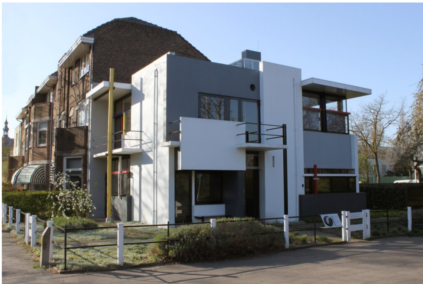
Gerrit Thomas Rietveld, Casa Schröder, esterno, 1924, Utrecht (Wikimedia/Hay Kranen).

Purtroppo ai nostri giorni è molto difficile “creare” e noi siamo costretti a vivere in mezzo all'espressione plastica del passato. Gli individui e i gruppi che si sono liberati dall'influenza passatista soffrono a causa di quest'espressione deprimente. Essi hanno trovato un mondo nuovo finora irrealizzato. Eppure, anche soffrendo, essi stanno pervenendo alla realizzazione delle loro idee; per loro ogni creazione (nella misura in cui la maggioranza arretrata lo consente) è una brillante dimostrazione. La massa preferisce vivere nel passato. Poiché la massa detiene il potere e poiché d'altra parte i materiali per la costruzione sono duraturi e costosi, ne segue che un generale e rapido rinnovamento dell'ambiente è oggi quasi impossibile. Grazie però e alla forza delle nuove creazioni individuali e alle nuove esigenze della vita, il vecchio modo di costruire è destinato a estinguersi.