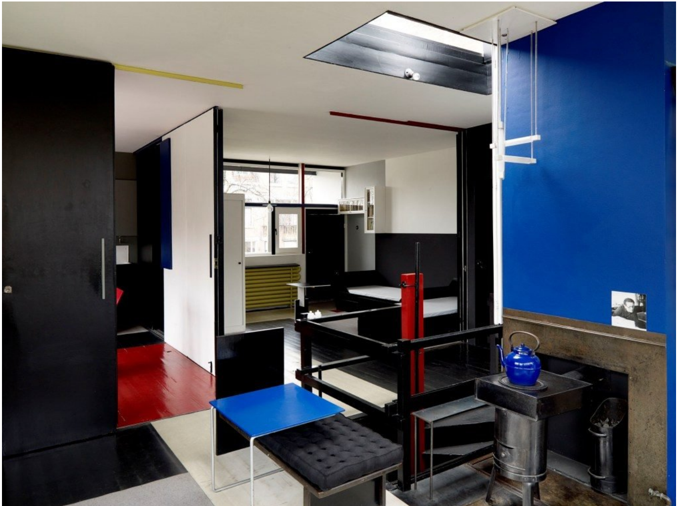
Gerrit Thomas Rietveld, Casa Schröder, l'interno coi pannelli scorrevoli che sezionano il soggiorno, 1924, Utrecht.

Dalla pittura neoplasticista è scaturita una nuova estetica. Nell'organizzazione di taluni interni e in pochi edifici la cui costruzione è libera dalla tradizione, possiamo discernere il nuovo spirito del tempo e scoprire le leggi di creazione recente. Queste leggi rivoluzionano la vecchia concezione architettonica, che è stata purificata e semplificata dalle nuove esigenze poste dai nuovi materiali e dagli sforzi audaci di vari architetti.