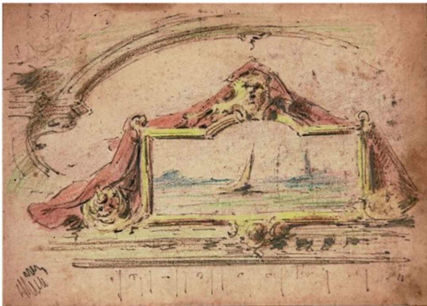
Giovanni Biasin, Marina , schizzo per gli ornati di Palazzo Rossi a Badia Polesine.

quotidiana, dagli appunti riproducenti ornati presenti in oggetti e monumenti, alle idee per nuovi ornati messe a punto dagli stessi Biasin. Chi come noi si occupa di decorazione e di decoratori non può fare a meno di notare il perfetto parallelismo coi taccuini di Antonio Basoli (1774-1848), decoratore e ornatista bolognese, professore di Ornato nella riformata Accademia di Belle Arti di Bologna, tra l'età napoleonica e la restaurazione. Pur se antecedente di vari decenni ed operante in una diversa area geografica, Basoli redigeva infatti i propri taccuini con modalità e scelte tematiche sostanzialmente identiche a quelle dei Biasin, a testimonianza di una prassi ben consolidata fra i decoratori.