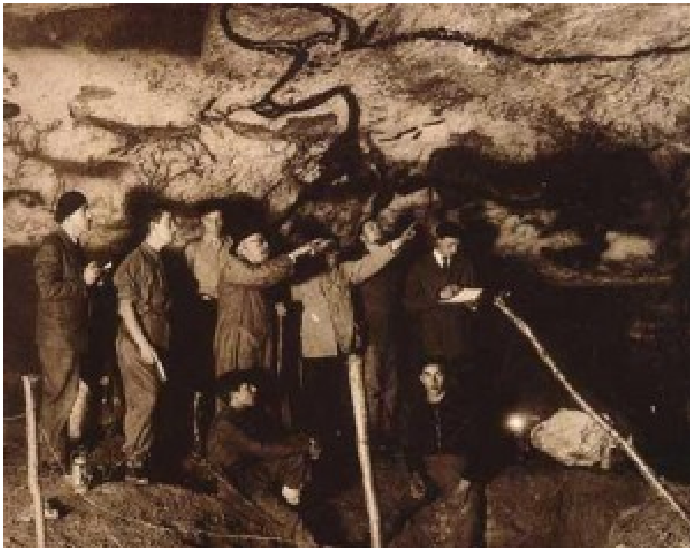
I primi visitatori delle grotte di Lascaux in una fotografia del 1940.

occidentale, “quadri” sono le tesi delle avanguardie novecentesche, “quadri” sono gran parte degli oggetti circolanti nel mercato dell’arte, “quadri” sono la quasi totalità di quanto è esposto nel circuito delle grandi mostre visitate da folle imponenti.