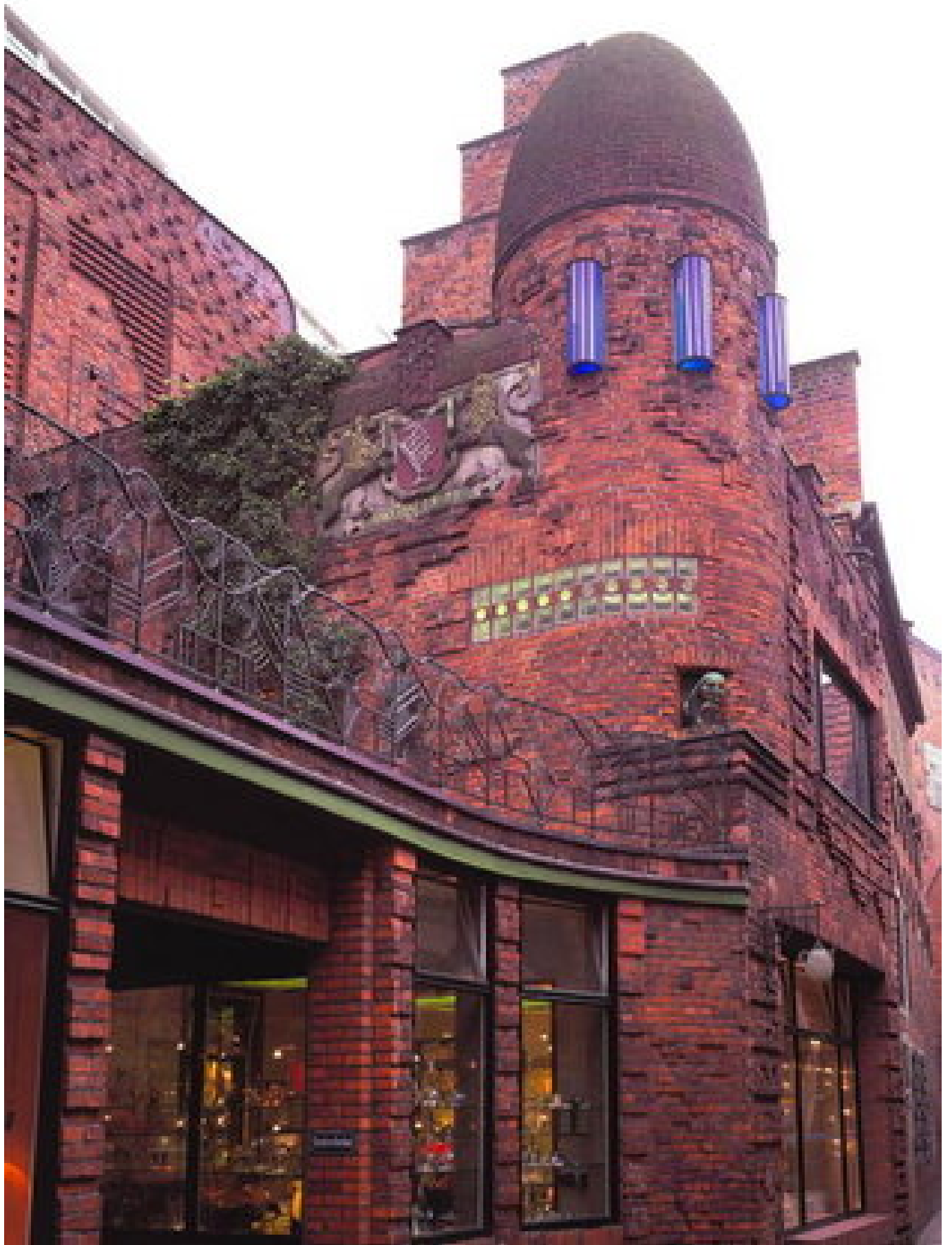
Paula Modersohn-Becker Haus.