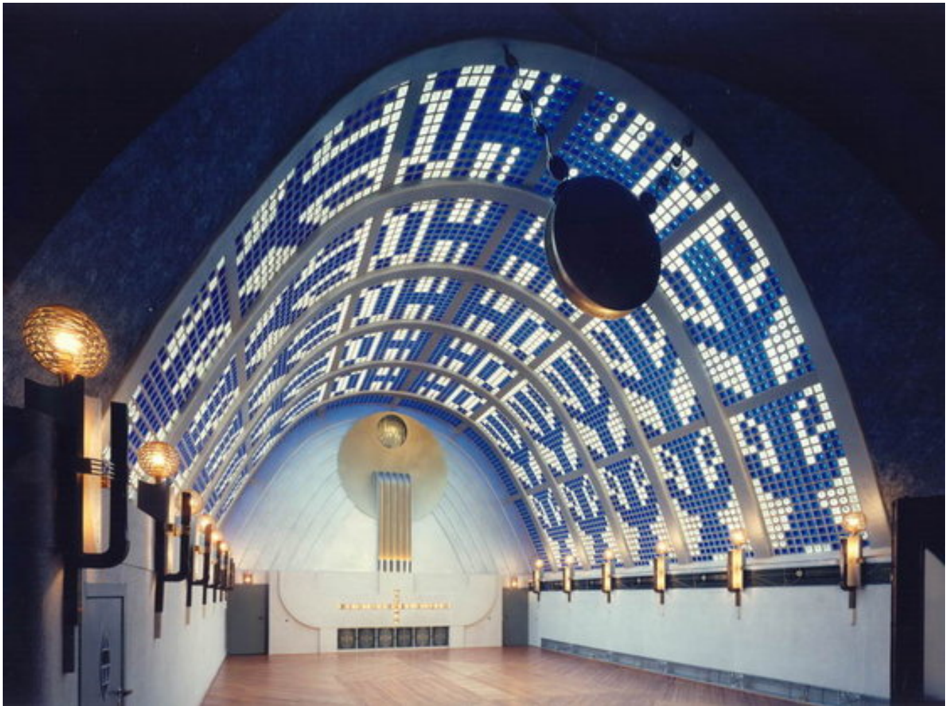
Haus Atlantis, Himmelssaal.

Ma senza dubbio non si può rimanere indifferenti alla Haus Atlantis , la “Casa Atlantide”: la sua facciata imponente e modernissima, soprattutto se considerata nel contesto in cui è inserita, venne ridisegnata da Ewald Mataré nel 1965 dopo che andò distrutta in un incendio durante la Seconda Guerra Mondiale. L’edificio fu progettato da Hoetger nel 1930-1931 e gli interni, originali, sono in stile Art Déco; percorrendo la scalinata si arriva all’ultimo piano dove è possibile ammirare la Himmelssaal (“Sala del Cielo”), anch’essa un interessante esempio di architettura tedesca del periodo tra le due guerre.