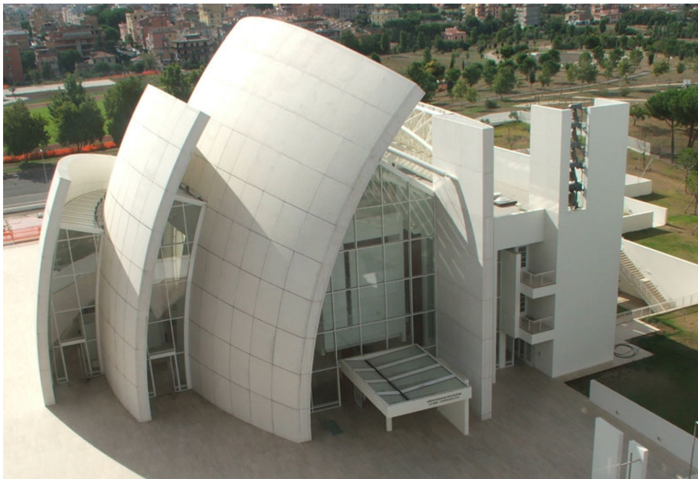
Richard Meier, Chiesa di Tor tre teste, 1998-2002, Roma.

diocesane di arte sacra che approvano i suddetti orrori. E' pure da supporre che ciò avvenga perché i componenti delle commissioni d'arte sacra, spesso ignari di competenze architettoniche, ambiscono esibizionisticamente ad apparire "moderni", e di larghe idee "avanguardiste". E' sintomatico che San Vincenzo de' Paoli dicesse, non tanto paradossalmente: «La Chiesa non ha nemici peggiori dei preti».