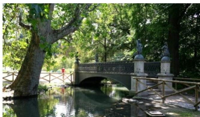
Collocazione originaria del Ponte delle Sirenette in una fotografia del 1920 circa; collocazione attuale.

Quando la cerchia dei navigli che cingeva il centro storico di Milano era ancora in funzione, nei pressi dell'attuale via Pietro Mascagni sorgeva un ponte in ghisa. Costruito nel 1842 su progetto dell'ingegnere Francesco Tettamanzi, fu il primo ponte in ferro della città. La struttura venne fusa