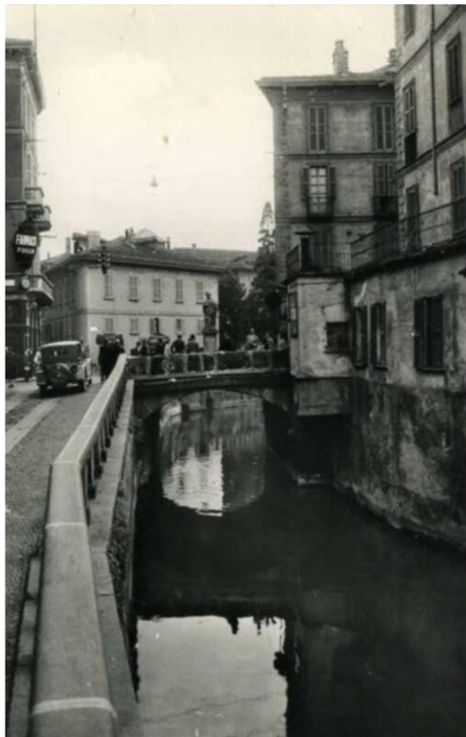
Il Monumento a San Giovanni Nepomuceno, con l'angelo che regge la palma del martirio; una fotografia primonovecentesca del naviglio che scorreva lungo via Francesco Sforza, con la statua di San Giovanni Nepomuceno al centro del ponte.

Sempre in tema religioso, nella corte interna del Castello Sforzesco sorge il Monumento a San Giovanni Nepomuceno , scolpito in marmo nel 1729, l'anno della sua canonizzazione, da Giovanni Dugnani. Jan Nepomucký (questo il nome in lingua ceca del santo) fu canonico della cattedrale di Praga, e venne martirizzato nel 1393 per annegamento nel fiume Moldava. A causa di ciò lo si considera protettore delle persone a rischio di annegamento. Proprio in tale veste, due sue immagini statuarie erano un tempo collocate presso i Navigli. Lo si ricorda anche come patrono dell'esercito imperiale austriaco, di stanza a Milano all'epoca in cui la scultura venne commissionata. L'appellativo "Nepomuceno" deriva da Nepomuk (Repubblica Ceca), località di nascita del santo. Un nome di difficile pronuncia dunque, che, nel linguaggio popolare, finì col diventare San Giuàn né pù né men ("San Giovanni né più né meno").