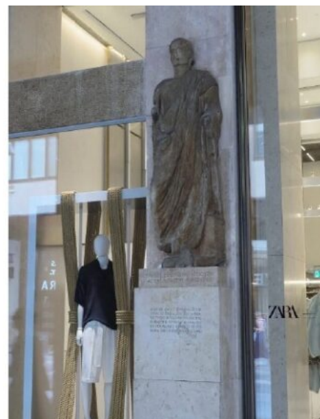
Facciata della Casa degli Omenoni; la statua romana denominata "El Scior Carera".

Questa rassegna si conclude con El Scior Carera ("Il Signor Carera") ovvero