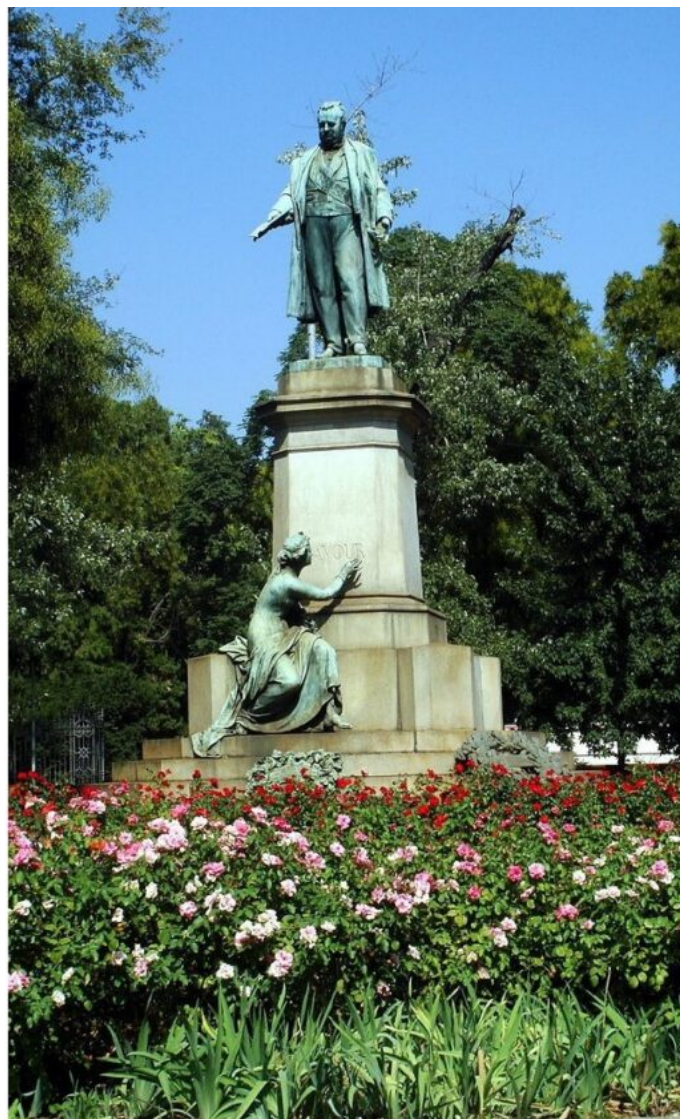
Il Monumento a Cavour in una fotografia ante 1881 di Giacomo Brogi (Wikimedia); in un'immagine recente (Giovanni Dall'Orto/Wikimedia).