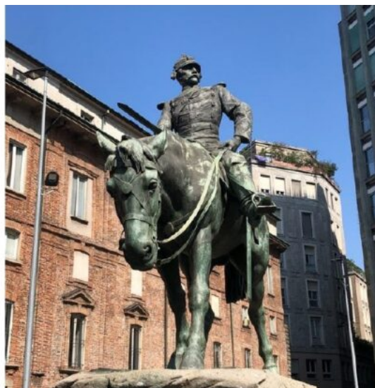
L'inaugurazione del Monumento a Giuseppe Missori in una fotografia pubblicata nel 1916 su "L'Illustrazione italiana" (Wikimedia); uno scorcio del gruppo bronzeo (Wikimedia).

Non lontano, nei pressi di Piazza Duomo, vi è lo slargo intitolato al colonnello delle guardie garibaldine Giuseppe Missori. Inaugurato nel 1916, il Monumento a Giuseppe Missori è opera dello scultore Riccardo Ripamonti (1849-1930), che raffigurò il militare a cavallo dopo la battaglia, in atteggiamento vigile e marziale. L'animale, invece, appare visibilmente provato. Il contrasto tra le due figure è evidente. Questa caratteristica colpì l'opinione pubblica, e il bronzo divenne noto col soprannome Al cavall stracch ("Il cavallo stanco"). Oggi, chi si sente esausto o svogliato tende a dire di essere stressato. All'epoca bastava dire te me paret el caval del Missori ("mi sembri il cavallo di Missori"). Il metallo utilizzato per l'opera derivava dalla fusione vecchi cannoni e venne fornito gratuitamente