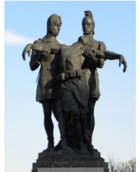
Il Monumento ai caduti di Porta Romana in una cartolina degli anni venti-trenta; uno scorcio del gruppo bronzeo.

La prima guerra mondiale evoca sacrifici umani immensi quanto, spesso, totalmente inutili. Quando tematiche di tale portata vengono rappresentate in modi retorici, iconograficamente ambigui, è normale che esse suscitino ironia e sarcasmo. È il caso del Monumento ai caduti di Porta Romana , inaugurato nel 1923 per ricordare le vittime del primo bombardamento aereo su Milano. Esso sorge nell'area sulla quale, il 14 febbraio 1916, erano cadute le bombe sganciate dagli aerei austriaci. Lo scultore Enrico Saroldi (1878-1954) immaginò un gruppo di tre figure, composto da un soldato romano e da uno della Lega Lombarda intenti a sorreggere la salma di un caduto. La scelta dei due militi si spiega col fatto che, secoli addietro, tanto l'esercito romano quanto i comuni medievali avevano avuto a che fare col nemico teutonico. Tuttavia, l'accostamento è tutt'altro che chiaro al comune spettatore. Nessuna meraviglia, dunque, che i milanesi abbiano appiccicato all'opera il nomignolo I tri ciucc ("I tre ubriachi"). Essa evoca infatti la scena di tre amici, di cui due apparentemente alticci e abbigliati con travestimenti da carnevale, che ne sorreggono un altro in stato di coma etilico, per portarlo a casa.