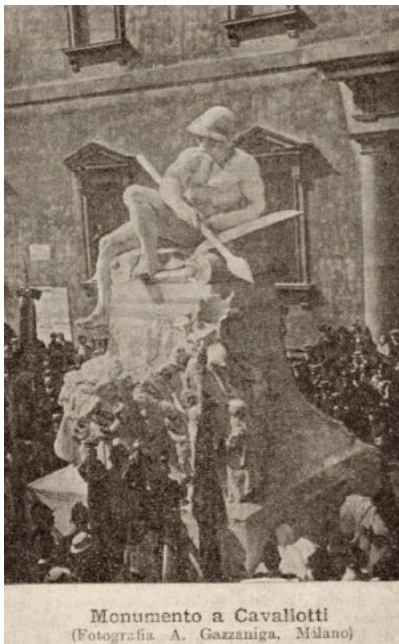
Monumento a Cavallotti (Fotografia A. Gazzaniga, Milano)

dal governo, mentre la prima guerra mondiale infuriava. Forse anche per questo, la tristezza del destriero sfinite non passò inosservata.