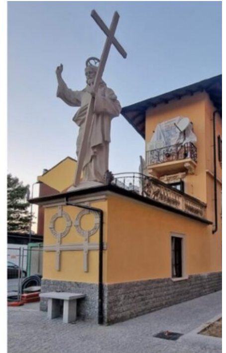
Il Cristo Redentore in una fotografia del 1975; fotografato nel 2012 con la mano destra mancante; dopo i lavori di pulitura e ripristino.

Di autore sconosciuto e realizzato nel corso del XIX secolo in graniglia e sabbia del Ticino impastate con cemento, l'imponente Cristo Redentore si trova sulla terrazza di una palazzina in via San Dionigi, nel quartiere Corvetto. Nell'insieme, e tenuto conto della forma longitudinale e rastremata dell'edificio che gli fa da piedistallo, esso ricorda la polena di una nave. La denominazione più familiare è El Signurun de Milan ("Il gran signore di Milano"). A seguire, la più prosaica El Cristùn de cement ("Il Cristone di cemento"). Entrambi gli appellativi sottolineano le dimensioni dell'opera, peraltro inferiori di oltre un metro rispetto a quelle della Madunina . Vistosamente sproporzionata rispetto al contesto circostante, la figura benedice con la mano destra alzata i pellegrini che si recano alla vicina abbazia di Chiaravalle. Ma la mano benedicente, con le tre dita distese, veniva anche scherzosamente interpretata come un simbolo e un promemoria dell'obbligo trimestrale di pagamento dell'affitto. Una scadenza molto sentita in quella zona popolare della città. La mano destra del Cristo era andata perduta anni fa per un banale incidente, dovuto a lavori di manutenzione urbana. Tra il 2020 e il 2022, interventi di restauro hanno portato al ripristino della mano e della cromia originale della statua.