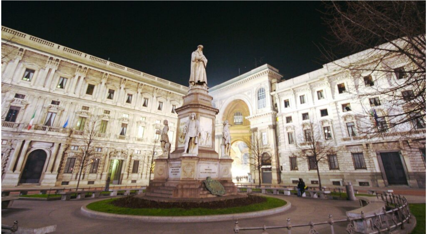
Il Monumento a Leonardo da Vinci sullo sfondo di Palazzo Marino e della Galleria Vittorio Emanuele.

nella sua odierna ubicazione, tra via Senato e via Marina.