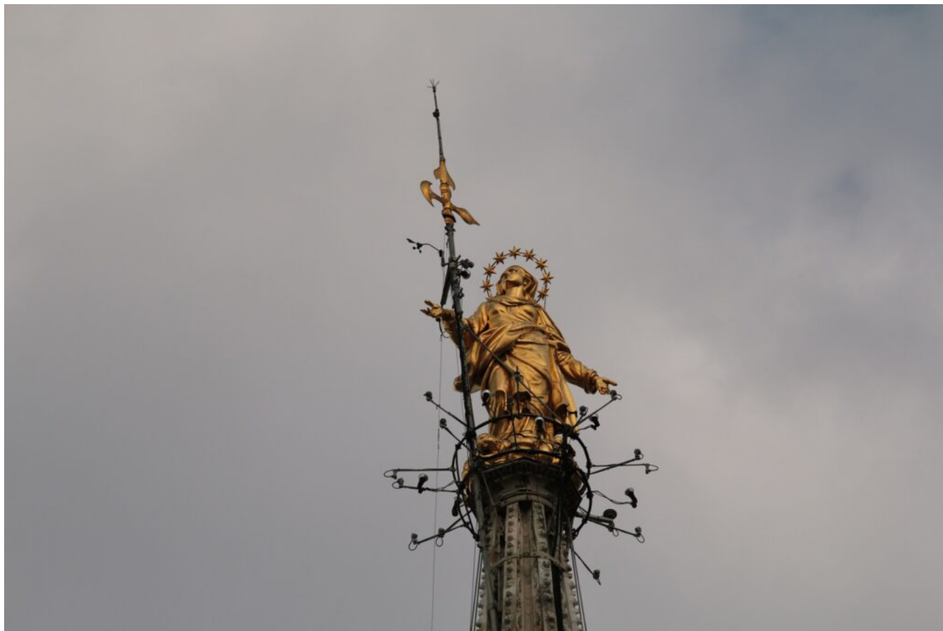
La Madonnina del Duomo.

Questo articolo è il primo di una serie che intende illustrare il rapporto fra popolo e statue, così come si è sedimentato nelle tradizioni e negli idiomi dialettali di alcune città italiane. Inizieremo da Milano, una città che, per stratificazione sociale, cultura civica, rilevanza e densità del patrimonio statuario è, soprattutto in epoca moderna e contemporanea, tra le più rappresentative d'Italia. Nel capoluogo lombardo si ricordano ancor oggi, per diversi monumenti celebri, appellativi nati dal basso, in alternativa alle titolazioni ufficiali [2].