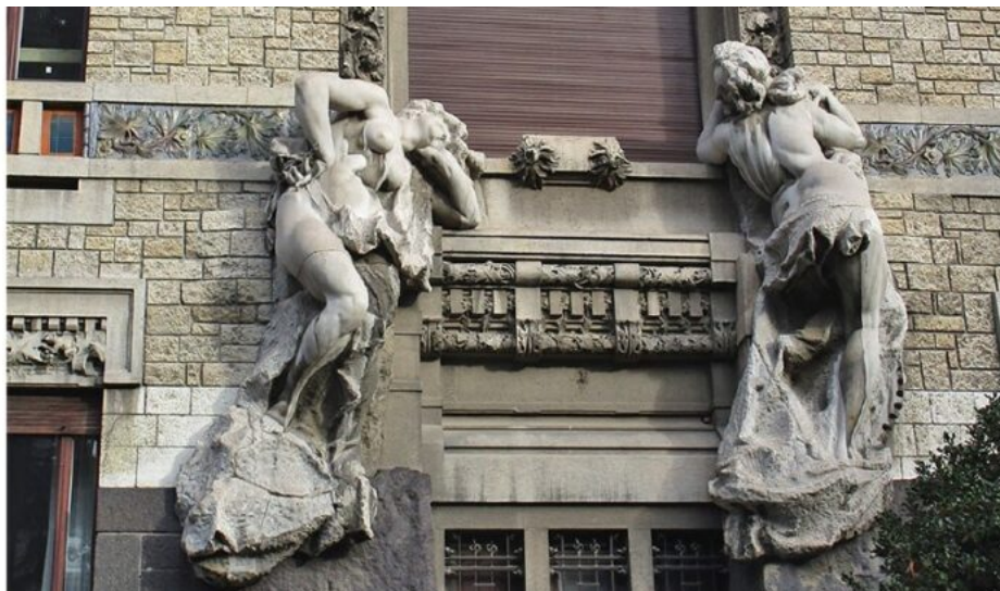
Le figure allegoriche dell'Industria e della Pace sulla facciata principale di Palazzo Castiglioni in una fotografia pubblicata nel 1905 su "L'Edilizia Moderna"; nella collocazione attuale.

Nel 1901, l'architetto Giuseppe Sommaruga (1867-1917) progettò per il palazzo Castiglioni, in Corso Venezia, una delle più originali facciate liberty di Milano. Su di essa spiccavano due figure allegoriche in marmo, l'Industria e la Pace, realizzate dallo scultore Ernesto Bazzaro (1859-1937). La procacità dei nudi femminili e la loro posa provocante guadagnarono all'edificio un appellativo che ne fece ben presto un oggetto di derisione e di critica: La cà di ciapp ("La casa delle natiche"). A seguito dello scandalo, la proprietà fece smontare le figure, che furono poi ricollocate dal Sommaruga in un altro edificio meno in vista, villa Faccanoni, situata in via Buonarroti 48.