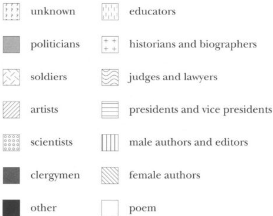
Schema della distribuzione degli autografi per professione (da Peck 1988, p. 268).