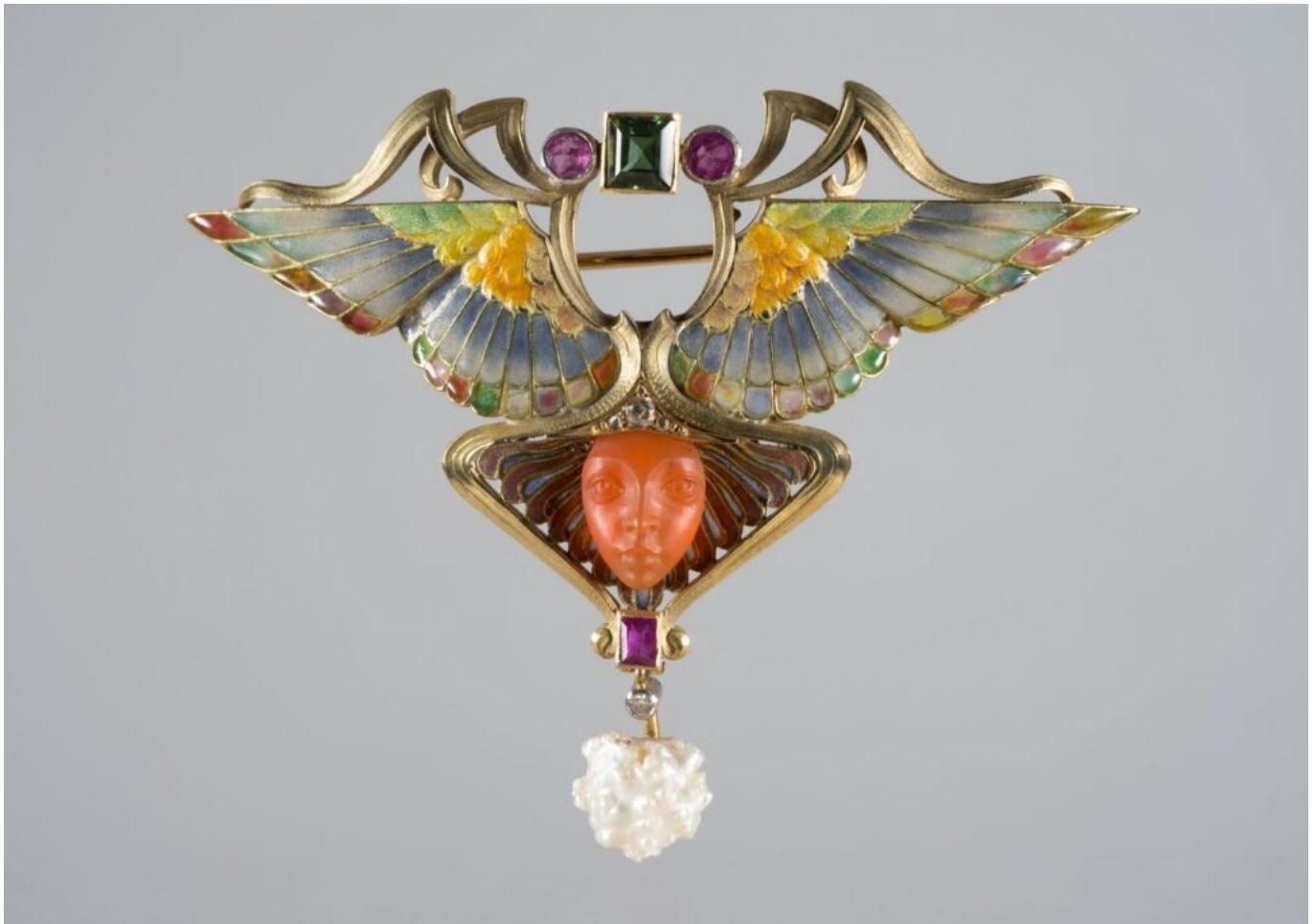
Philippe Wolfers, Nike, 1902, spilla in oro, perla, diamante, ametista, smeraldo, corniola e smalto, cm. 5 x 7, Bruxelles, Musées royaux d'art et d'histoire.

Nella Francia medievale vi era una volta una disposizione che proibiva a tutte le persone al di sotto di un certo rango di portare gioielli d'oro. È qui presente, nella maniera più chiara, la combinazione che sorregge tutta l'essenza dell'ornamento: con esso l'accentuazione sociologica ed estetica della personalità confluiscono come in un punto focale, l'essere-per-sé e l'essere-per-altri diventano a turno causa ed effetto. Infatti la distinzione estetica, il diritto dell'attrattiva e del piacere possono spingersi qui soltanto fino al punto segnato dalla sfera d'importanza sociale del singolo; e proprio in questo modo il singolo aggiunge all'attrattiva che l'essere ornato acquista per la sua apparenza del tutto individuale, l'attrattiva sociologica di essere in virtù di quella un rappresentante del suo gruppo, "ornato" di tutta l'importanza di esso. Sugli stessi raggi che, emanando dall'individuo, danno origine a quell'ampliamento della sua sfera di impressioni, viene recata a lui l'importanza del suo ceto, simboleggiata da questo ornamento; e l'ornamento appare qui come il mezzo per trasformare la forza o dignità sociale in una distinzione personale evidente.