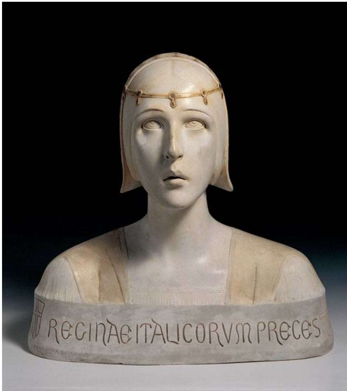
Luigi Bistolfi, Reginae Italicorum preces , gesso, 1900, h. cm. 48, Genova, Wolfsoniana.

come ostili l'una contro l'altra, si svelano ovunque intimamente connesse, così nelle azioni sociologiche reciproche, in questo campo di battaglia dell'essere-per-sé e dell'essere-per-altri degli uomini, la formazione estetica dell'ornamento segna un punto in cui queste due direzioni opposte dipendono reciprocamente l'una dall'altra in quanto scopo e mezzo.