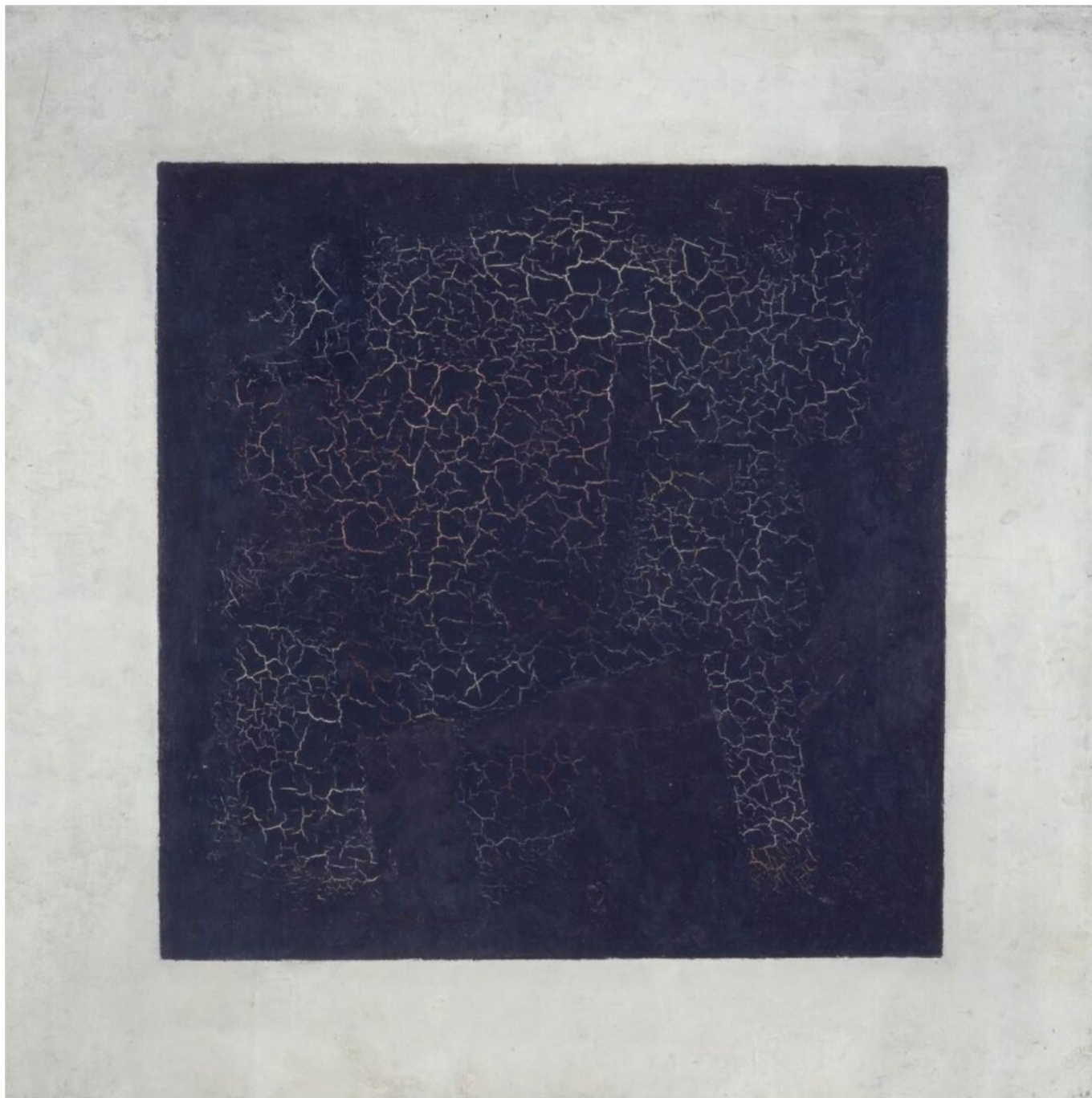
Kazimir Malevič, Quadrato nero , 1915, cm. 79,5 x 79,5, Mosca, Galleria Tretyakov.