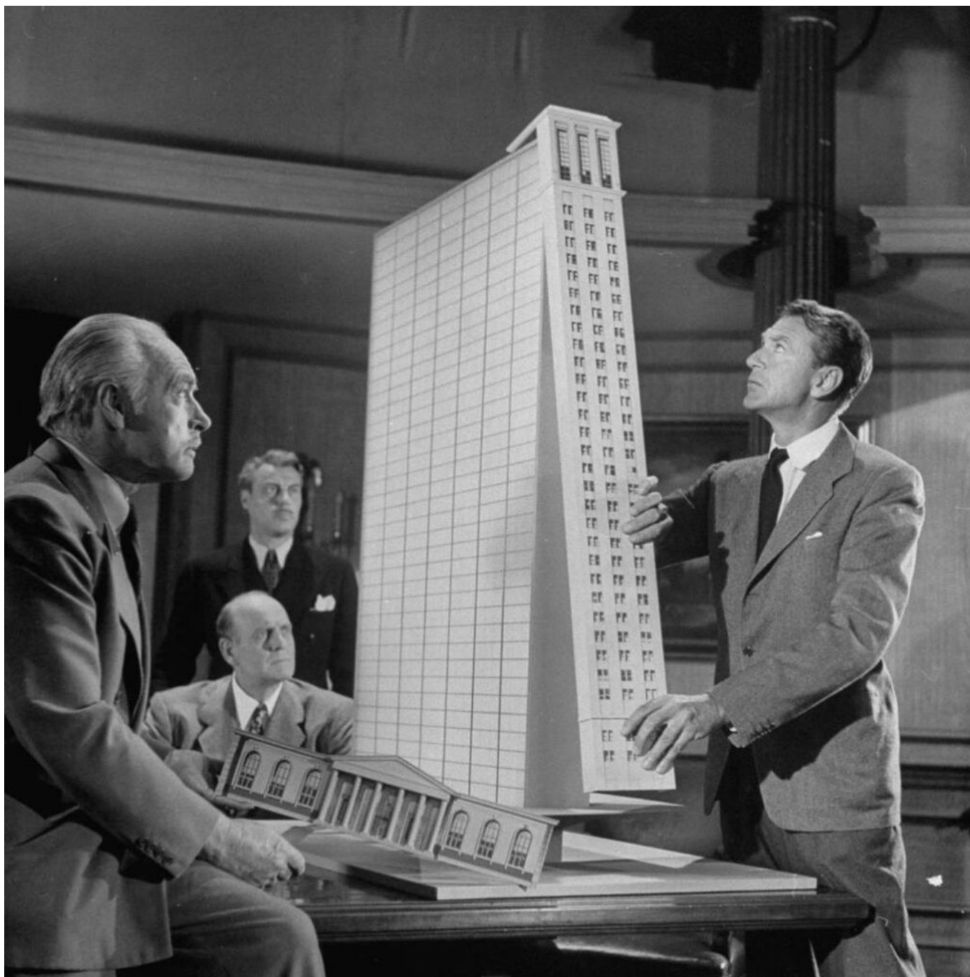
Un fotogramma del film "La fonte meravigliosa" ("The Fountainhead"), 1949, regia di King Vidor, con Gary Cooper e Patricia Neal.

Abbiamo iniziato prendendo in esame un preciso atteggiamento – il pregiudizio contro la decorazione in arte – e ci siamo ritrovate in un labirinto di miti e mistificazioni. Isolando le citazioni dal contesto, non vogliamo affatto ridicolizzare gli artisti e i critici che ne sono autori. Quel che è certo è che continuare a leggerli con spirito acritico è solo un modo per perpetuarne gli errori. Il linguaggio con cui le loro affermazioni sono scritte è spesso datato – d'altronde, alcune risalgono a oltre cent'anni fa – ma i loro punti di vista fanno ancora da guida all'odierna teorizzazione sull'arte.