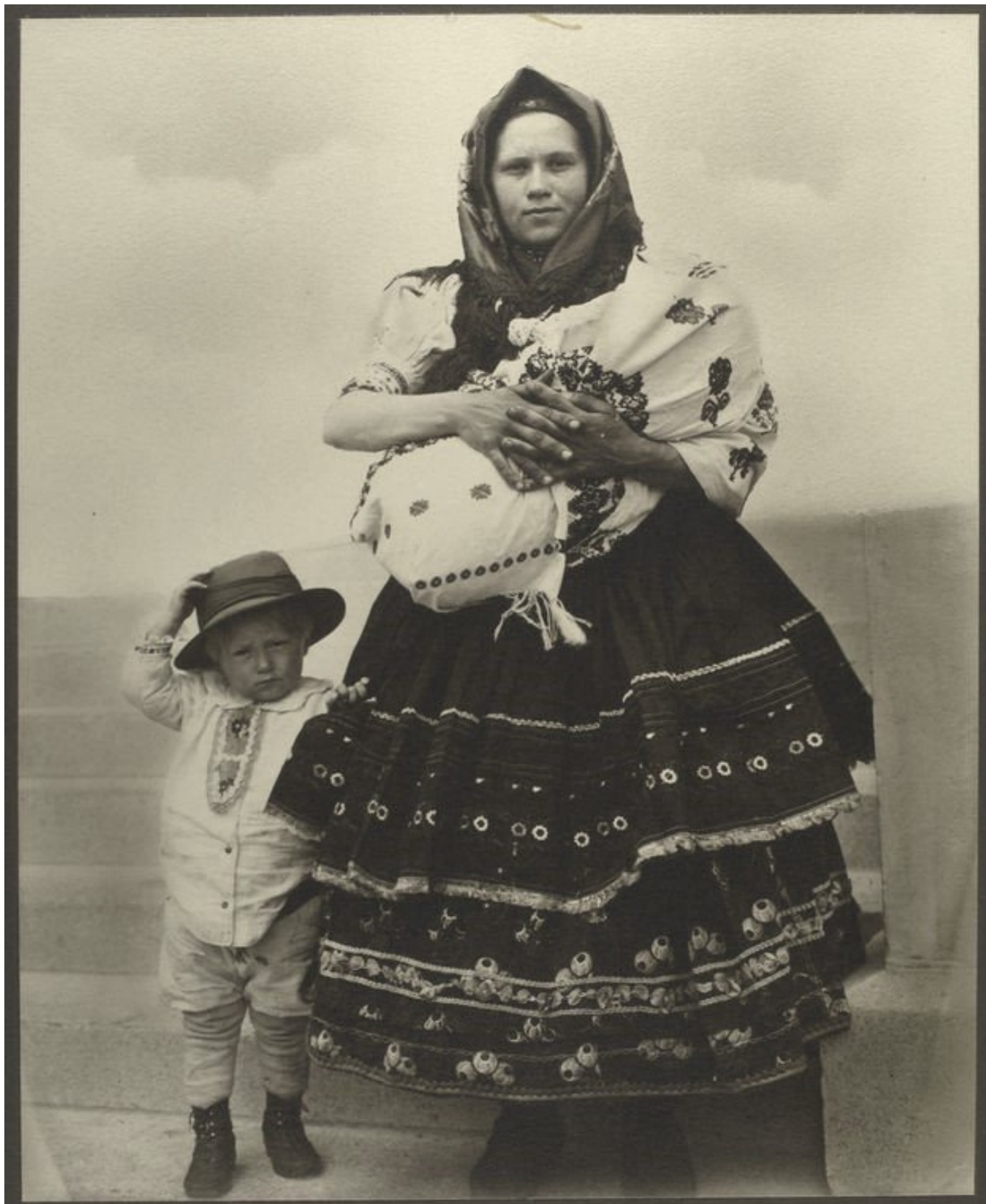
Augustus Francis Sherman, Emigrante slovacca con figli all'arrivo a Ellis Island, fotografia, 1906-14, New York, New York Public Library (NYPL/ Wikimedia).

Fobia della contaminazione razziale, impotenza e decadenza