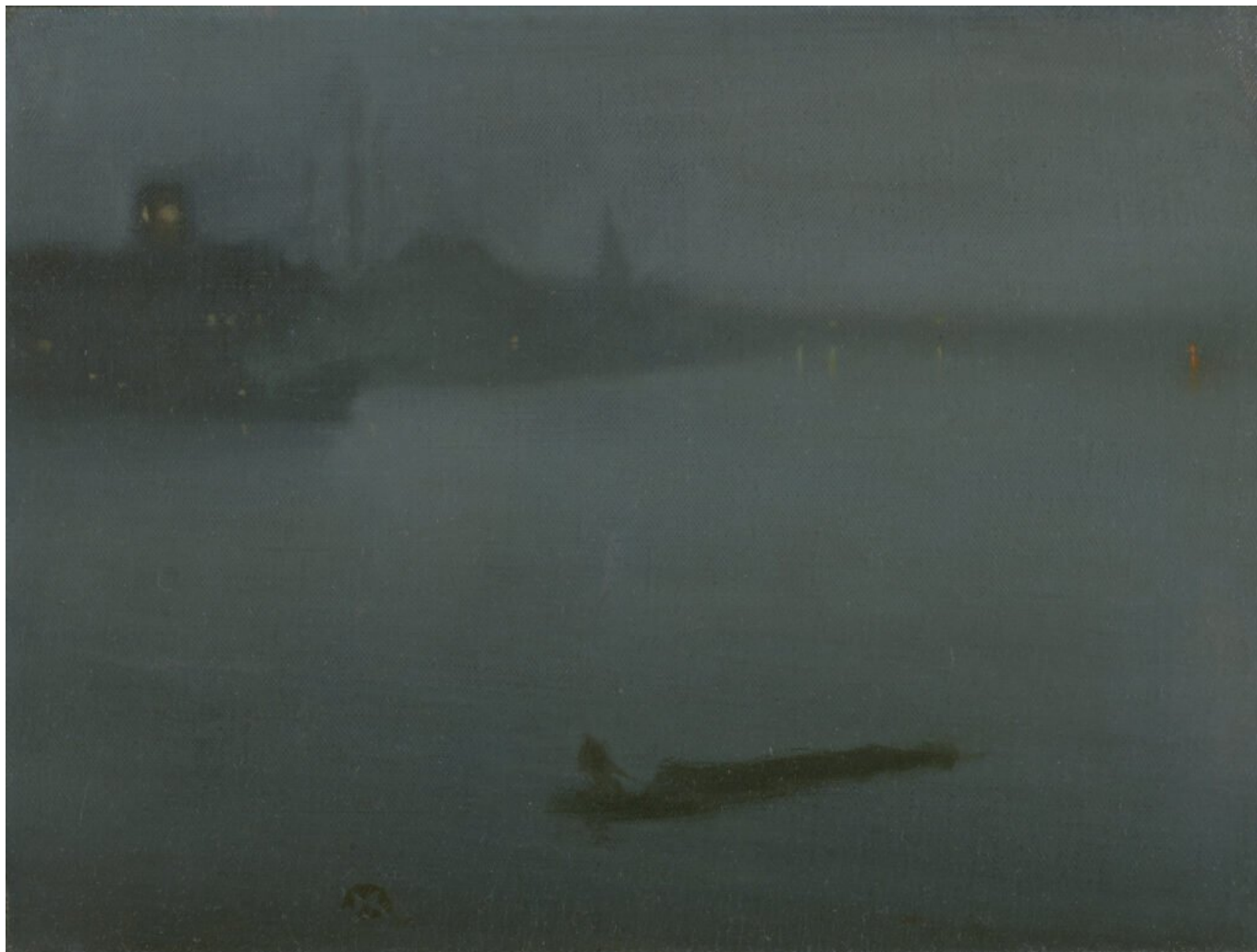
James McNeill Whistler, Notturmo in blu e argento , 1872-78, olio su tela, cm. 69 x 85, New Haven, Yale Center for British Art.