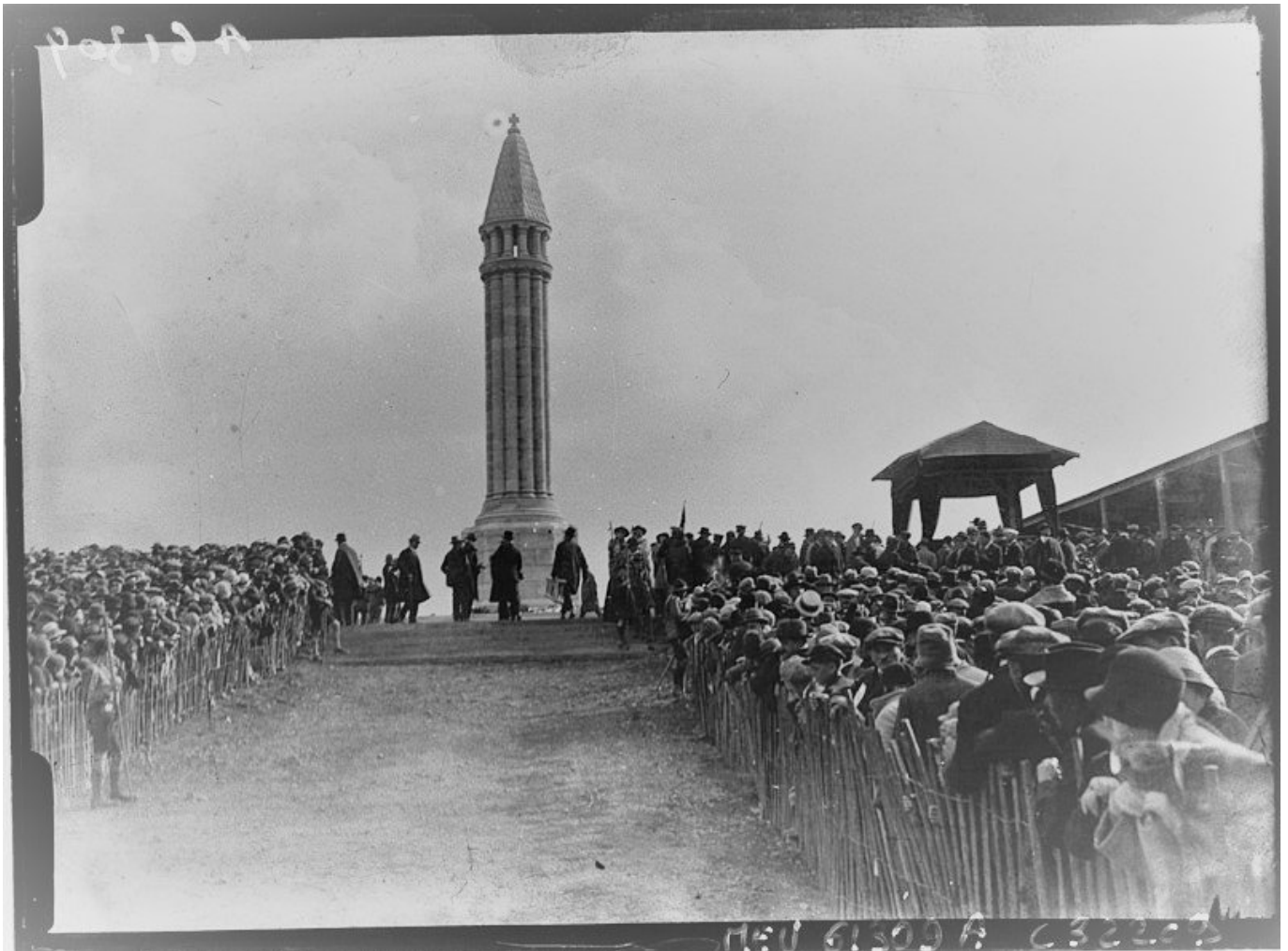
Inaugurazione del monumento a Maurice Barrés al Signal de Vaudemont, Sion, in uno scatto fotografico dell'agenzia stampa Meurisse, 1928 (Gallica/BNF).

una più gentile gracilità, atrofizzano in sé stessi i sentimenti, si compiacciano della povertà e della meschineria di questa gentucola».