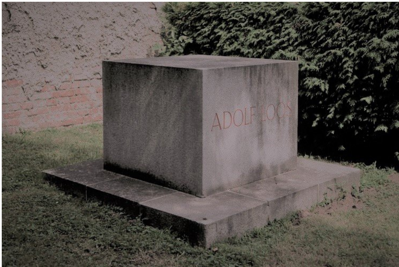
Tomba di Adolf Loos, Vienna, Cimitero centrale.