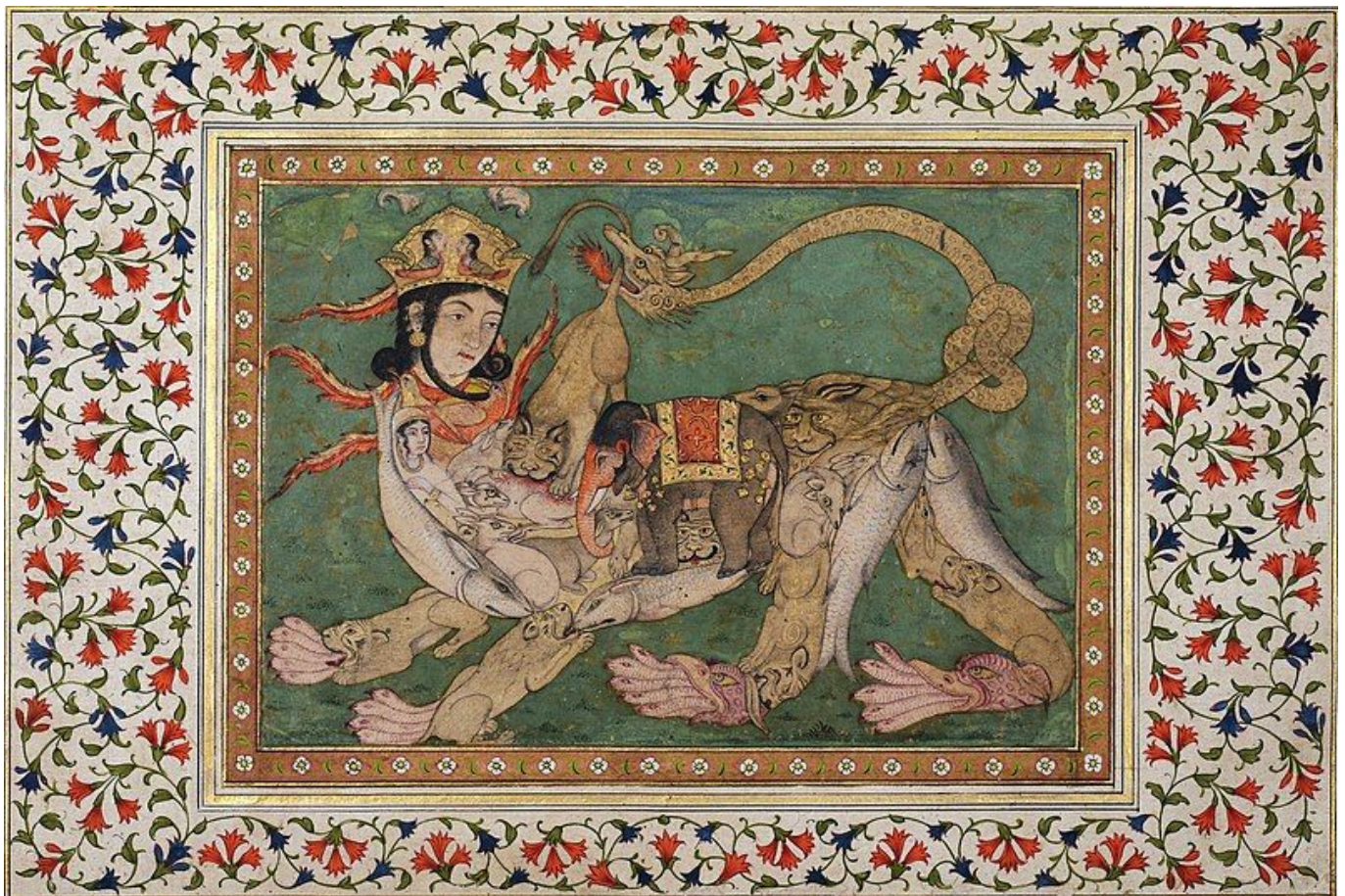
Arte indiana del Deccan, Destriero mistico ("Burāq") in forma composita, pagina miniata, 1770 circa, cm. 26 x 38, New Delhi, National Museum (Wikimedia).

«Come avrebbero potuto un egiziano, un assiro, un buddista, raffigurare il loro dio crocifisso se non distruggendo il proprio stile?».