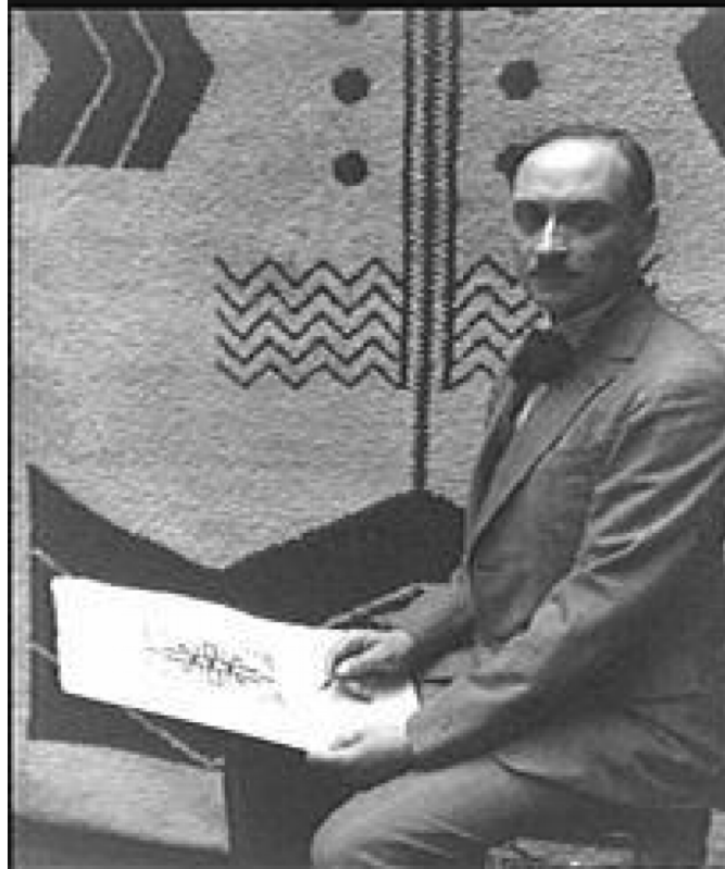
Ivan da Silva Bruhns fotografato nel suo atelier.

Decoratore validissimo, per la sensibilità con cui progetta tappeti in una carriera intensa e ricca di successi, è il francese di origini brasiliane Ivan da Silva Bruhns (1881-1980). Il suo periodo più felice si colloca negli anni compresi tra le due guerre mondiali, in sintonia con lo stile Art Déco che, dopo aver trionfato nel 1925 all' Exposition Internationale d'Art Decoratives et Industriels di Parigi, dilaga in Europa e negli Stati Uniti. In seguito, l'artista ritorna con successo all'amore giovanile per la pittura, ma la sua importanza storica gli deriva proprio dall'essere stato un designer di tappeti e non, come altri, un pittore occasionalmente prestato all'industria tessile. In questa specifica veste, la sua statura artistica ha pochi paragoni nel secolo XX.